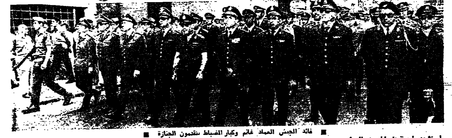
قائد الجيش العماد فاتم وكبار الضباط يتقدمون الجنازة